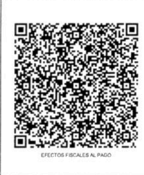
EFFECTOS FISCALES AL PAGO

CFDI RELACIONADOS: ESTE DOCUMENTO ES UNA REPRESENTACION IMPRESA DE UN CFDI TIPO RELACIÓN: - CFDI RELACIONADO