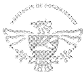
REPRESENTANTE DE SINDICATURA SINDICO PROCURADOR DEL H.IX AYUNTAMIENTO DE PLAYAS DE ROSARITO